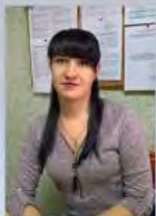
ПАЛЬЧИКОВА НАТАЛЬЯ СЕРГЕЕВНА,

ORCID (ID) – 0000-0003-0290-3265 SPIN-код автора – 4544-5308