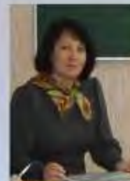
МЕЗЕНЦЕВА СВЕТЛАНА АНАТОЛЬЕВНА,

ORCID (ID) – 0009-0091-5123-5481 SPIN-код автора – 5954-2113