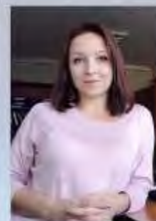
БИБА ЕКАТЕРИНА ВАЛЕРЬЕВНА,

ORCID (ID) – 0000-0002-5624-8205 SPIN-код автора – 2080-5200